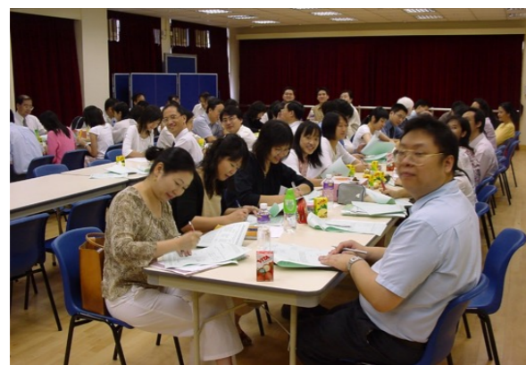
所有老師簽訂合約，一同服務本校。 (攝於 07-2003)