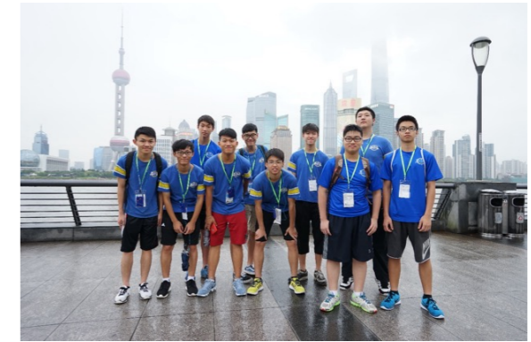
高中體育文憑科學生到上海考察，參加不同的體育 訓練及認識祖國的體育發展。(攝於 27-06-2016)