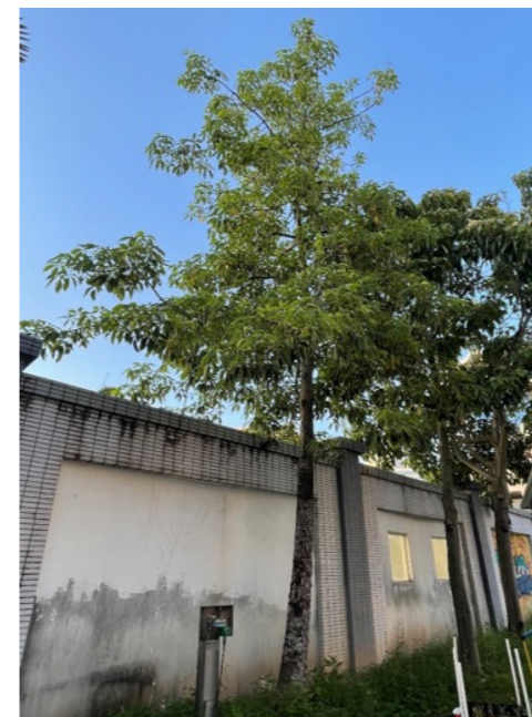
第三屆畢業生送給學校的木棉樹， 不知不覺已十七載了，並健康地 聳立在足球場後。(攝於 01-08-2022)