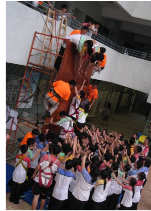
中四級紀律訓練營，全級學生於紅磚地 挑戰高牆攀爬。(攝於 25-08-2010)