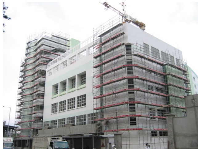
興建中的校舍： 當時很擔心未能趕及於九月一日開學。 (攝於 12-05-2003)

今年是中華基督教會基道中學二十週年校慶，作為一位喜愛攝影的老師，想藉著以下相片，記錄及分享一些校園內外的點滴。