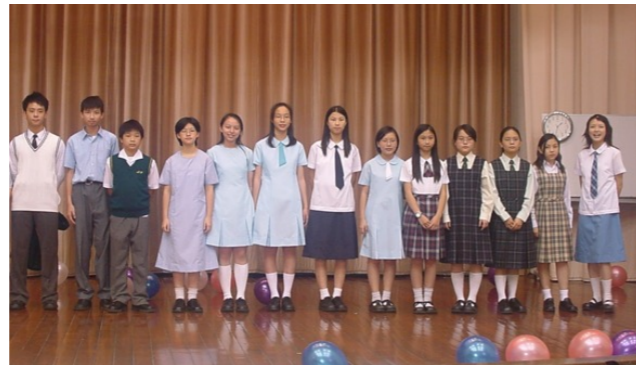
校服的誕生： 學生以模特兒行走的時裝表演形式展示校服， 讓同學投票揀選校服。(攝於 06-2003)